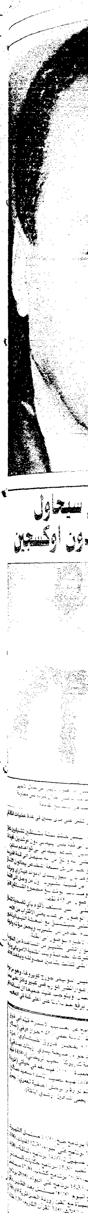
يصل العالم السابق للملاكمة مايك تايسون فأجرا الأوساط الرياضية العالمية مباراة المصراع مع صديقه بلال العالم شون ميشيلز (إلى اليسار)